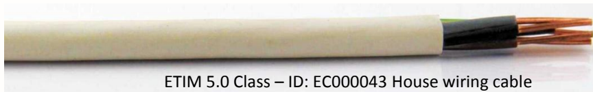
ETIM 5.0 Class – ID: EC000043 House wiring cable

Przewody okrągłe instalacyjne o żyłach miedzianych jednodrutowych (D) o izolacji PVC (Y) i powłoce PVC (Y), z żyłą ochronną (żo) lub bez, na napięcie znamionowe 450/750 V